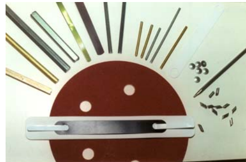
Abb. 5: verschiedene Materialien die auf unseren Säulenpressen gefertigt bzw. montiert werden.