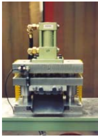
Abb. 1: 2- Säulen- presse als Schere

Unsere hydraulischen Säulenpressen mit bis zu 1000 kN Schließkraft sind zum Umformen, Prägen oder Stanzen hervorragend geeignet. Auf Wunsch liefern wir die Gestelle mit automatischer Materialzuführung.