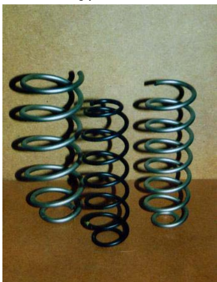
Abb. 2: Achsfedern